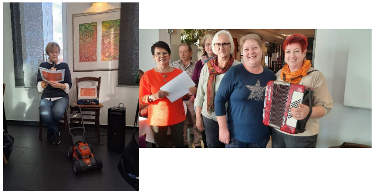
„Essen-Singen-Tratschen“ – Lesung und Chor