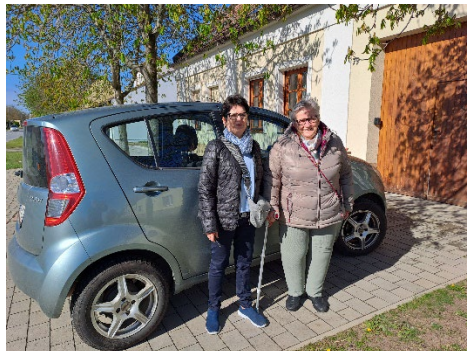
Gemeinsam zum Arzt

NACHBARSCHAFTSHILFE PLUS wünscht Ihnen ein gesegnetes Weihnachtsfest sowie Glück & Gesundheit im neuen Jahr!