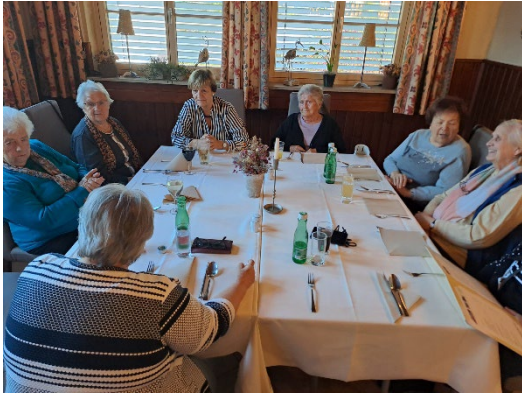
„Mahlzeit mitsammen“ in Wallern

Unsere netten ehrenamtlichen Helferinnen und Helfer unterstützen ihre Mitmenschen gerne beim Einkaufen, begleiten sie zu Arztterminen oder bei einem Spaziergang. Im vergangenen Jahr haben sie mehr als 200-mal anderen geholfen und dabei rund 420 Stunden wertvolle Zeit geschenkt. Bei diversen Veranstaltungen wie „Mahlzeit mitsammen“ trifft man sich in geselliger Runde, um gemeinsam zu essen, zu plaudern und Neuigkeiten auszutauschen.