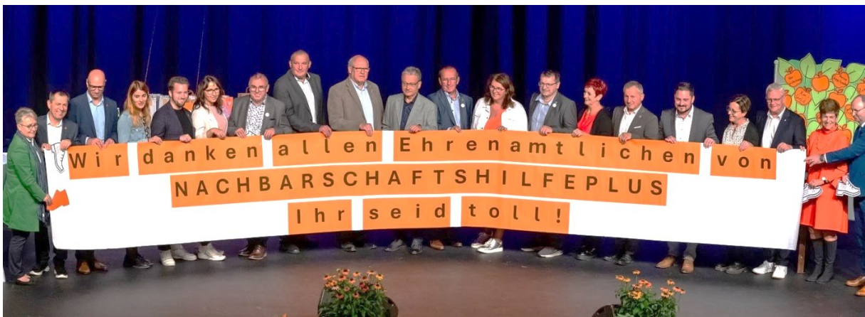
GemeindevertreterInnen aus den 20 burgenländischen Projektgemeinden

2014 in 6 mittelburgenländischen Gemeinden gestartet und 2024 auf 20 Gemeinden im ganzen Burgenland angewachsen, hat sich das überparteiliche Sozialprojekt NACHBARSCHAFTSHILFE PLUS in den letzten zehn Jahren als unverzichtbare Unterstützung für viele Menschen etabliert und maßgeblich zur Stärkung des sozialen Zusammenhalts in den Gemeinden beigetragen. Im Rahmen einer Dankesfeier für die ehrenamtlichen Helferinnen und Helfer von NACHBARSCHAFTSHILFE PLUS im Kulturzentrum Eisenstadt betonte Hofrat Mag. Anton Hörting vom Bundesministerium für Soziales die wesentliche Bedeutung des Projekts für die Gemeinden, dankte den Ehrenamtlichen für ihr unermüdliches soziales Engagement und gratulierte allen für dieses wirklich nachhaltige und professionelle Modell der gegenseitigen Unterstützung im ländlichen Raum.